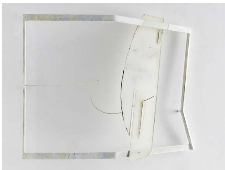
White shadow 2007, ferro, acciaio, plexiglass pigmentato, vernici, cm.70x80x15 ca.

La mostra è accompagnata da un catalogo con prefazione di Luigi Cavadini, testo di Claudio Cerritelli, e riproduzioni delle opere in mostra.